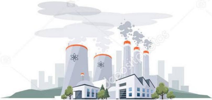
ENERGY FROM FINITE SOURCES